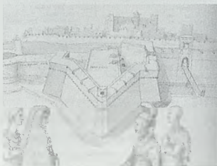
Baluartes frontales avanzados de la fortaleza de Salsas (según el plano de Ayora de 1503 guardado en la Academia de la Historia) y de Fuenterrabía (según el dibujo de Francisco de Holanda en 1538, guardado en El Escorial)