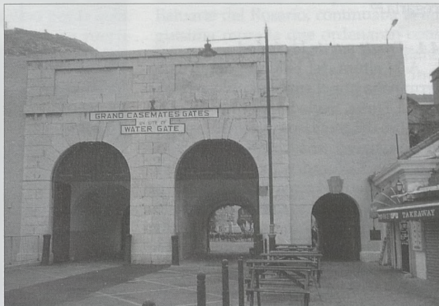
Grand Casemates Gates ocupan el lugar de la Puerta del Mar que describió Portillo en el siglo XVII

En el tramo de muralla medieval entre el Baluarte de San Pablo y el del Rosario, fueron arrasadas las almenas y dieciocho torres de flanqueo para construir en su lugar algunas plataformas a comienzos del 1600. Todas disponían de amplio espacio para el juego de los cañones, cercanas escaleras de acceso y depósitos de municiones. Se proyectaban estratégicamente sobre la costa, en posición flanqueante de los lienzos de muralla intermedios. Dominaban todas las zonas de desembarco de su períme-