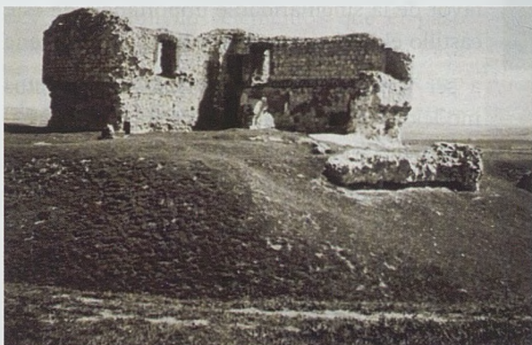
Figura 1: Fotografía tomada en 1953 por Germán Valentín-Gamazo

Le invito a visitar y al que puede acceder en metro, bajándose en la estación final de la línea 5, Alameda de Osuna o en los autobuses 101, 105, 112, 114, 115 y 151. Es pues un castillo «a mano» para todos los madrileños.