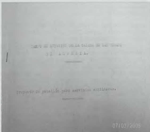
Portada del proyecto de campo de aviación militar diseñado por el arquitecto Guillermo Langle para la ciudad de Almería en octubre de 1936

Existía el precedente del aeródromo de la localidad granadina de Calahonda, próxima a Motril e igualmente al lado del mar, que fue fácil presa de bombardeos desde buques de guerra. Durante la batalla de Málaga, el día 7 de febrero, fueron destruidos o averiados todos los aviones que allí había 29 . Igualmente en Roquetas de Mar (Almería) se ubicó