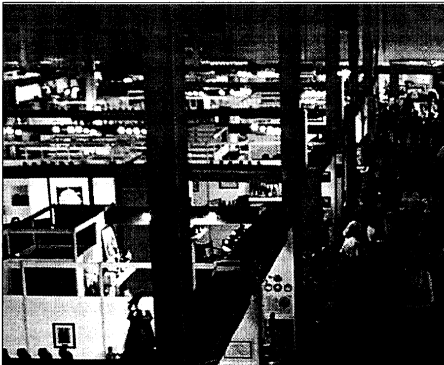
Sobre estas líneas, una imagen de la última Feria Regional de Alimentación celebrada en el 99.

Esta feria, que se celebra los años impares y por tanto al contrario que Alimentaria, en Barcelona,