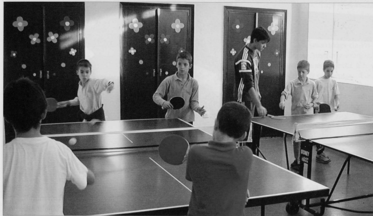
El Club Puertollano milita este año en Segunda División Nacional