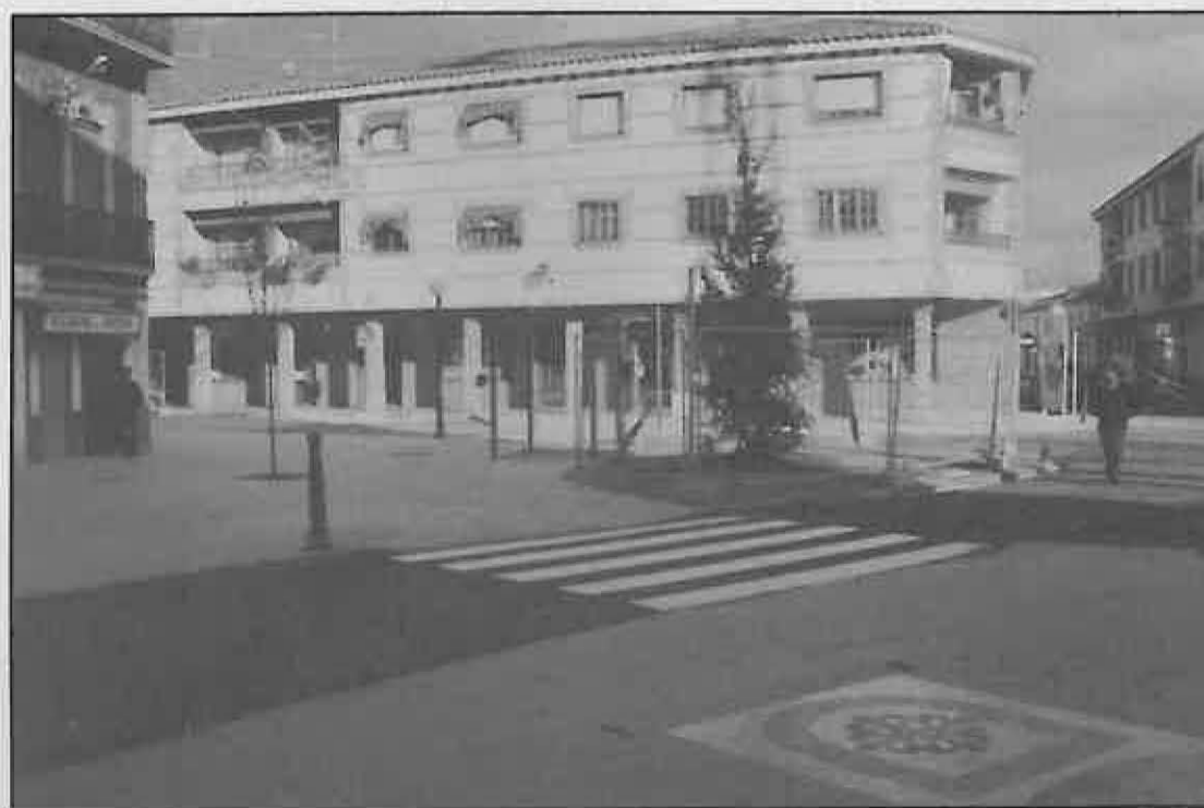
El nuevo perfil de las plazas céntricas permitirá ofrecer al ciudadano el mejor lugar para su distracción y asueto, al tiempo que mejorará la imagen del pueblo.