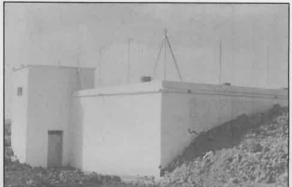
La construcción de un nuevo Depósito ha permitido el normal abastecimiento de la población a pesar del fuerte incremento de ésta.

cerniente al mantenimiento del servicio público de agua.