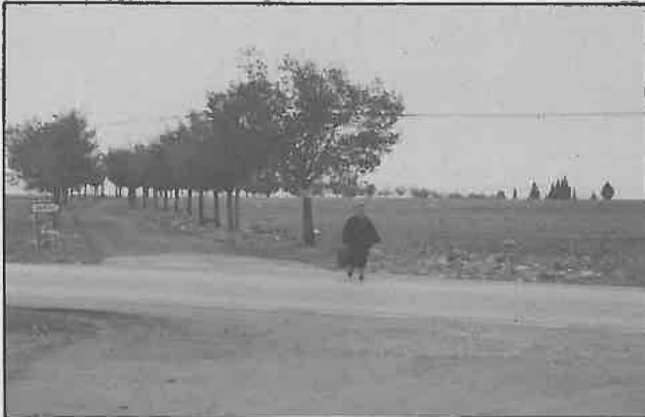
Nuestros caminos han mejorado notablemente. Hacía tiempo que se reclamaba el asfaltado del que conduce al cementerio, quedando en perfectas condiciones.