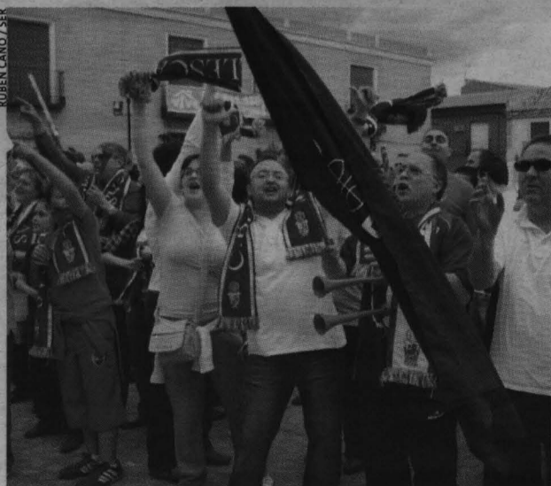
Un grupo de aficionados de la peña La Primera celebraron ayer el ascenso del Illescas a la segunda categoría del basket hispano.

El presidente explicó que el equipo estuvo el sábado celebrando el ascenso a la segunda categoría del baloncesto español en la feria cacereña después de ganar al Calefacciones Farho Gijón (68-78). Ayer domingo