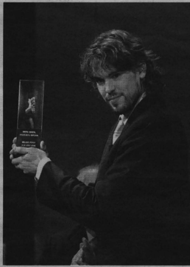
Marc logró ayer el premio al jugador más valioso de la ACB.

QUE RICKY RUBIO es aún un niño se evidencia en su andar encogiendo los hombros, en una timidez que le hace interrumpir su discurso para buscar las palabras adecuadas. No así en la pista, donde es un torrente, y no duda en gritar y aleccionar a sus compañeros. "En una cancha mando porque, como base, me toca organizar el equipo y porque allí no importa el DNI", explica. METRO