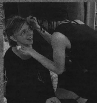
CICATRICES INDOLORAS. En la librería Kirikú y la Bruja triunfó la cicatriz en la frente igualita que la de Harry.