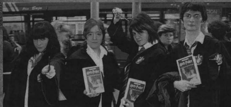
TÚNICAS DE HOGWARTS Y VARITAS MÁGICAS. Este grupo de amigos de Coslada (Madrid) vestía las túnicas de sus respectivas casas de Hogwarts. Miembros de Gryffindor, Slytherin, Ravenclaw y Hufflepuff en plena Gran Vía madrileña.