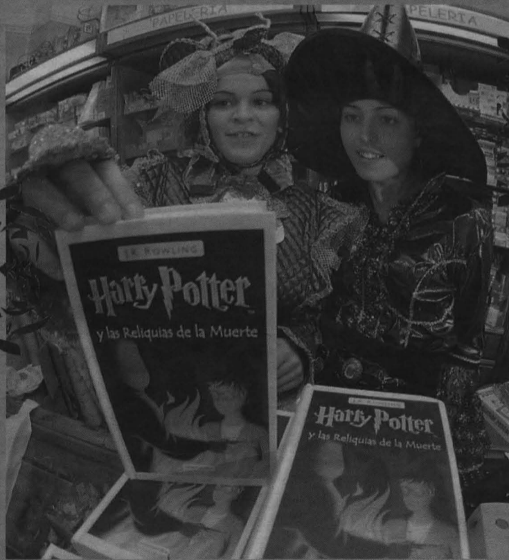
En Santiago de Compostela, tierra de meigas, no podían dejar de aprovechar la ocasión para echar a volar la imaginación con estos disfraces de brujas de inspiración genuinamente celta.