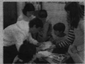
Alustiza atiende los requerimientos de los alumnos.