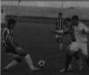
Una imagen del encuentro entre el Sevilla y el Partizán.