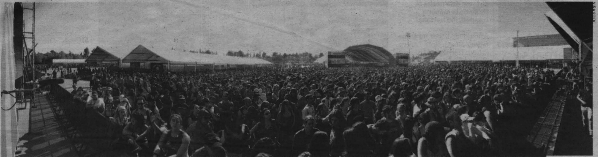
Vista panorámica del Viña Rock 2006. El Ayuntamiento y el nuevo promotor asociado han firmado un contrato por cuatro años con la intención de crear infraestructuras fijas en el auditorio.

Una de las causas que alegó el antiguo promotor del Viña para intentar trasladarlo a Benicassim fue el supuesto veto a determinados grupos, como Sociedad Alcohólica. La organización actual responde: "Su Ta Gar, Obrint Pas, Banda Bassotti o los propios S.A. han actuado en el Viña cuando estaban en el ojo del huracán, y eso nunca fue un impedimento". METRO