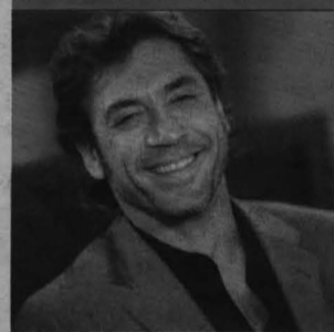
El actor Javier Bardem.