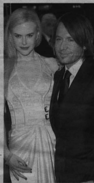
Kidman y Urban contrajeron matrimonio en 2006.