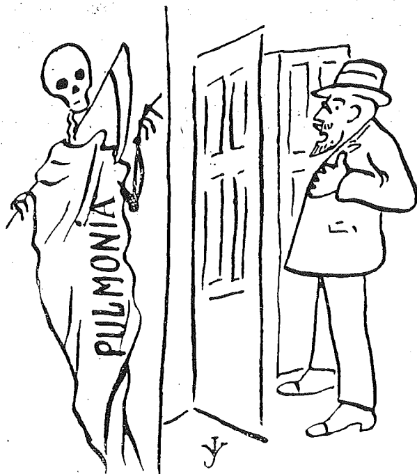
Te llamo y no vienes.....

El que desee adquirir joyas de última novedad, perfectamente construidas y grandemente económicas, debe hacerlo en la antigua casa de M. Francés, la única en esta Capital que las fabrica en sus Talleres y que ofrecen la más absoluta garantía en ealidad.