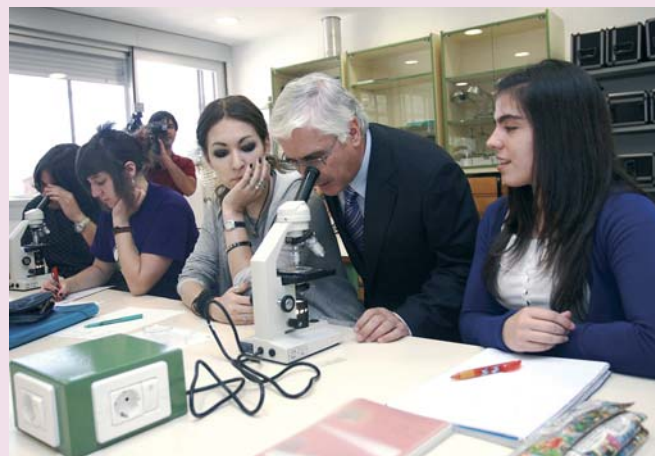
El presidente de Castilla-La Mancha, José María Barreda, junto a varias alumnas del IES Padre Juan de Mariana, de Talavera de la Reina, Toledo.

Aunque siguen siendo mayoría en los estudios de Humanidades, su presencia cada vez es mayor en las Ingenierías Técnicas.