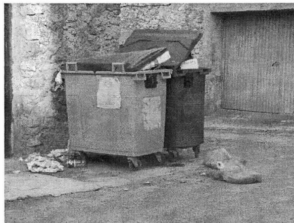
CONTENEDORES SIN SEPARACIÓN

basuras pero supongo que existirá un control sobre estos residuos y por tanto una selección y reciclaje.