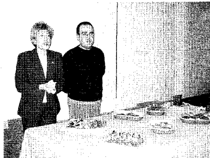
Tradicional Menú Navideño de la Asociación Luzán, ayer en el Alfonso VIII

7.- Lo más recomendable es comprar con antelación, pues permite comparar precios en distintos establecimientos y encontrar más variedad de productos. Además se evita la subida casi generalizada de precios de los últimos días.