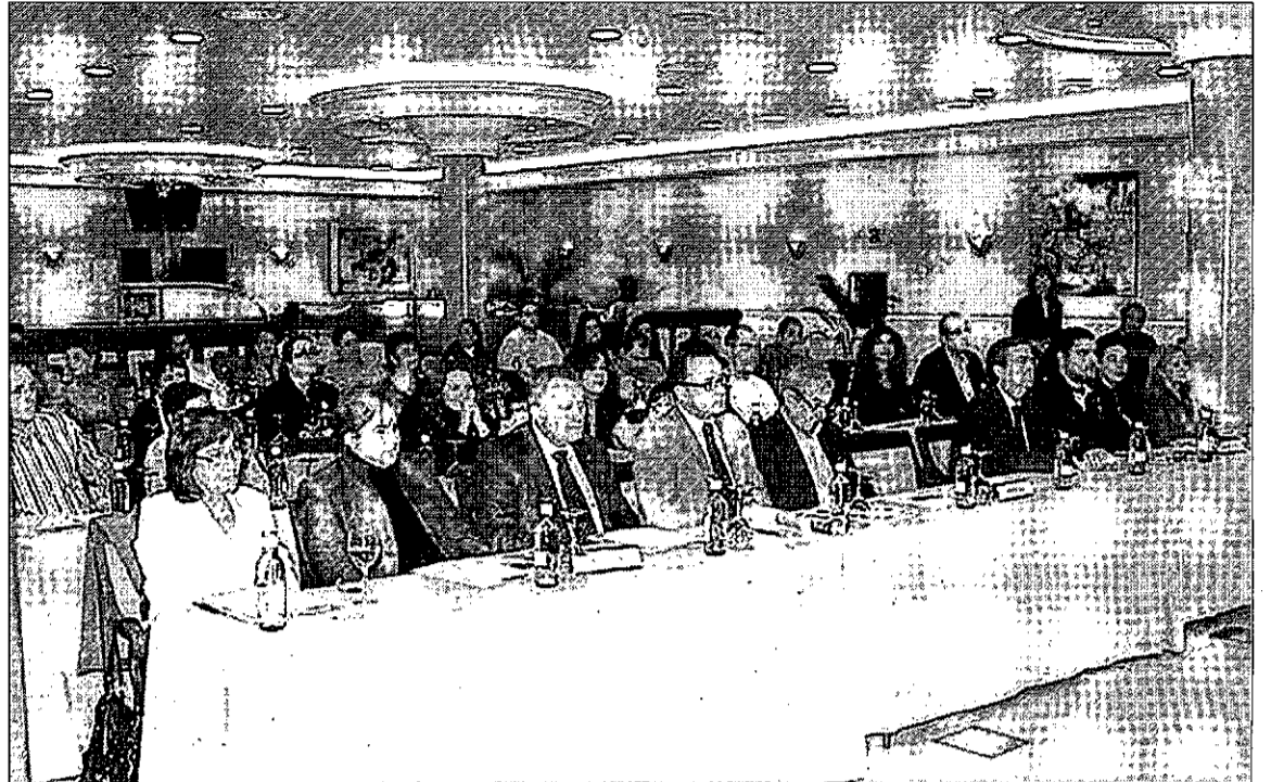
Un centenar de miembros de las 16 organizaciones de Cocemfe se dieron cita en las IV Jornadas de Empleo y Discapacidad.