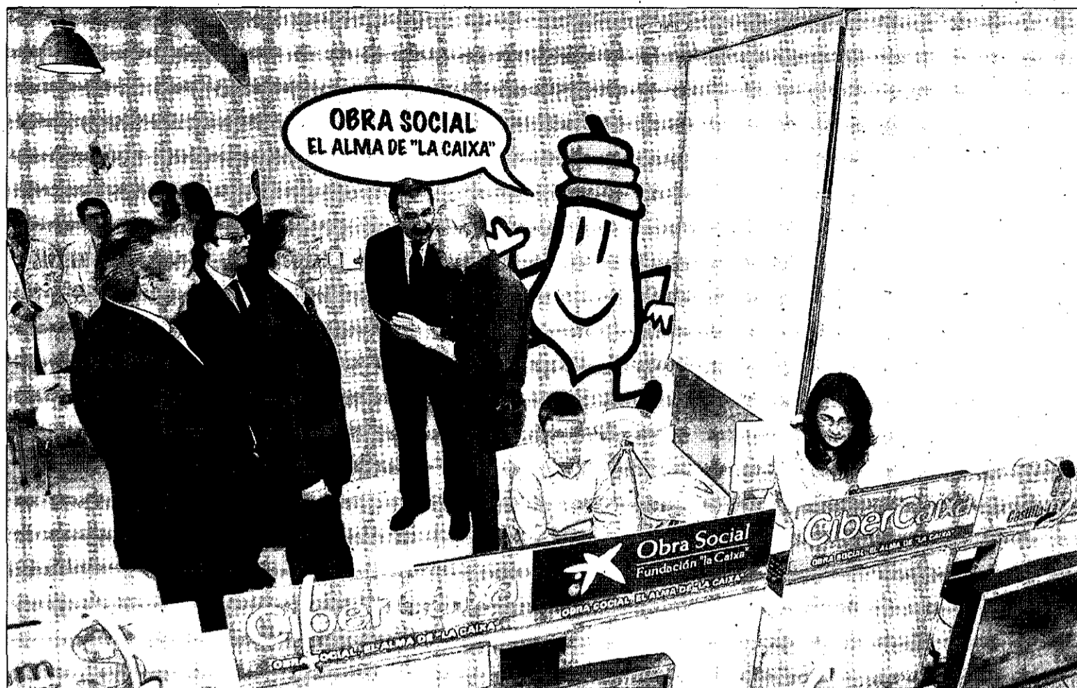
La CiberCaixa del Hospital General de Ciudad Real quedó ayer inaugurada con la presencia del consejero de Salud y Bienestar Social.