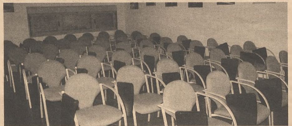
Detalle de la sala de reuniones. / Economía de Guadalajara

También será objeto de subvención la creación de puestos de trabajo en las condiciones que se establecen en estas bases. En este caso la ayuda puede alcanzar los 3.000€ por cada puesto de trabajo creado.