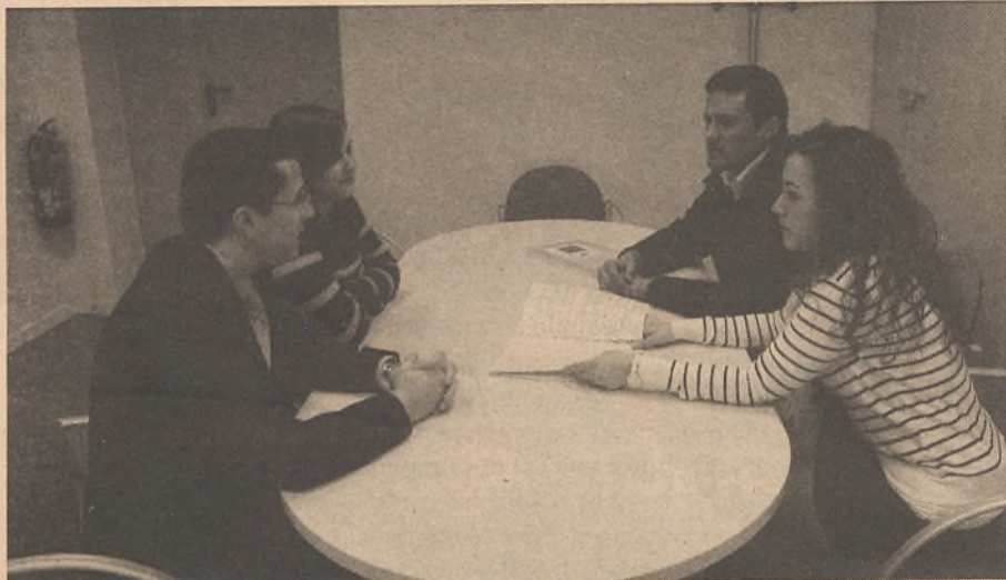
Momento de la reunión con el alcalde de la localidad.