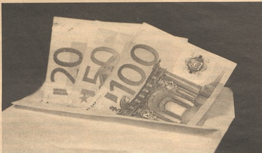
Se busca que el trabajador no pierda poder adquisitivo./Economía de Guadalajara

Como ya se ha mencionado, estos datos son provisionales, por lo que Empleo señala que, "los interlocutores sociales pueden pactar nuevos convenios en 2013 con efectos en 2012".