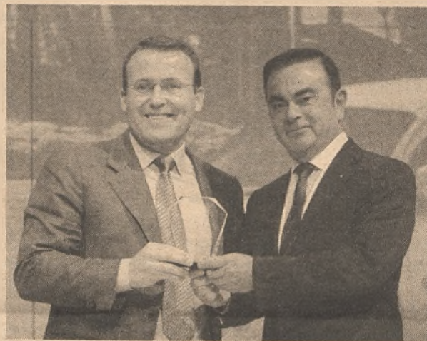
Momento de la entrega del galardón.

la Concesión ganadora su compromiso con los fundamentos básicos de nuestra Marca: la Satisfacción del Cliente con nuestro Servicio, Puesta en Valor de la Marca RENAULT y el Respeto al Medio Ambiente, al mismo tiempo pidió que trasladara la felicitación y agradecimiento a todos y cada uno de sus colaboradores.