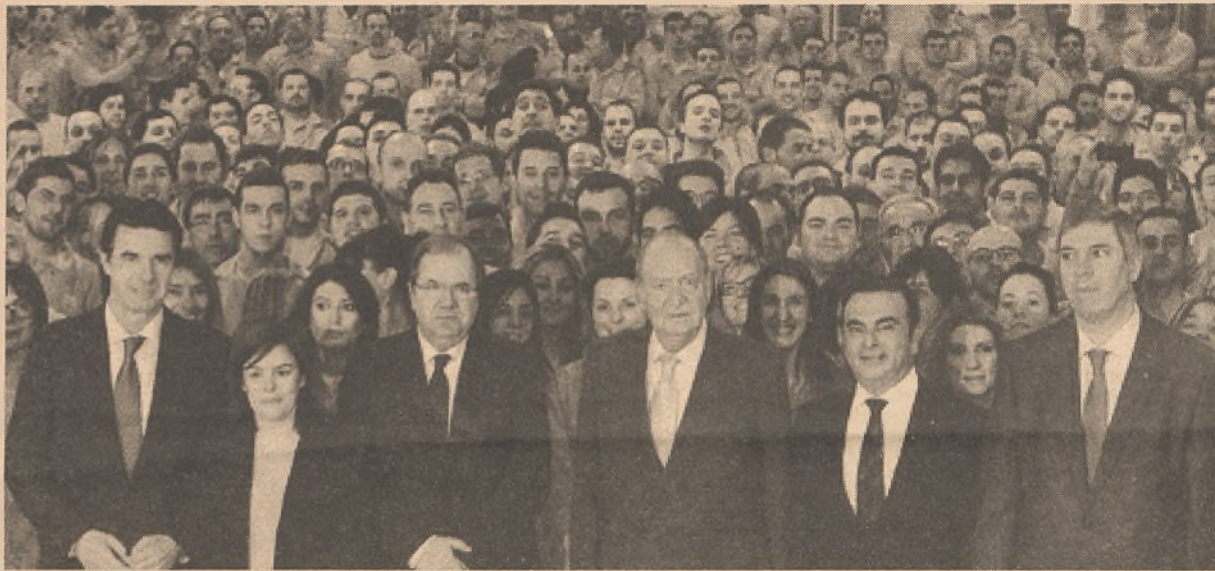
El Rey estuvo presente en la entrega de premios de Renault.