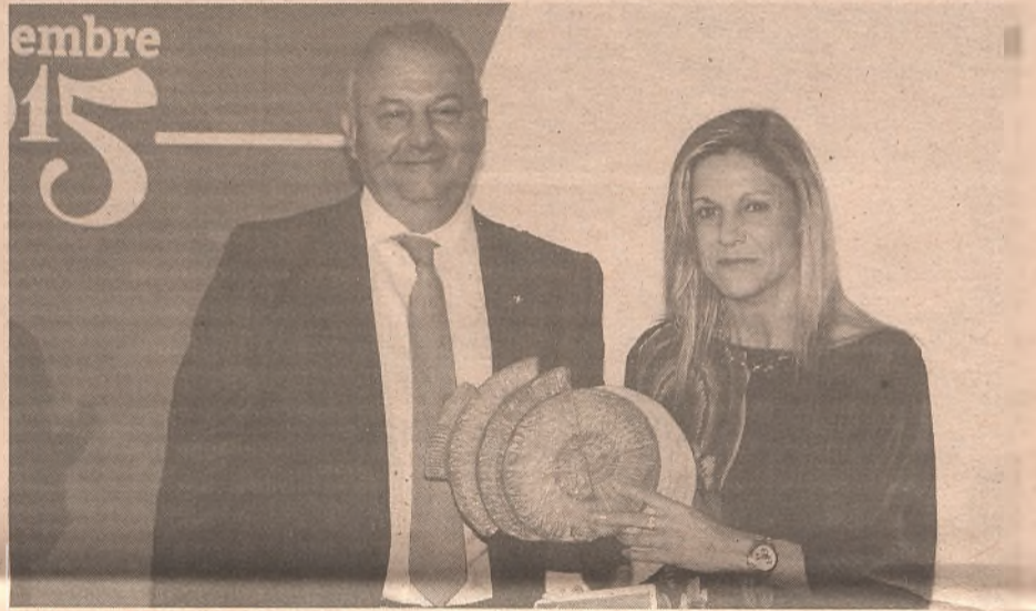
Establecimiento comercial Recoge: Raquel Cobo