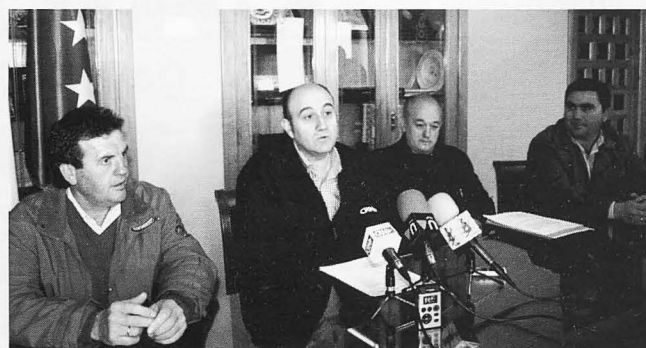
Los cuatro alcaldes de los pueblos que forman la Mancomunidad Vallehermoso.