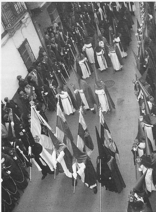
Banderas y nazarenos en la procesión de Jesús.

La procesión de la Santa Vera Cruz partió la noche del Jueves Santo con sus seis pasos tradicionales. En primer lugar el Niño Jesús, que a lo largo del año conservan en su convento las Monjas Dominicas, Jesús Orando en el Huerto, Ecce Homo, Jesús con la Cruz a cuestas y el Cirineo, Cristo del Amor y Doloro-