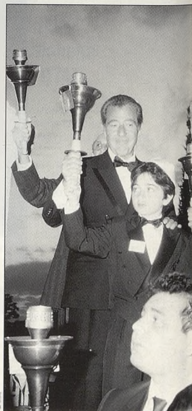
En el encuentro espiritual se procedió a los países que acogieron a los