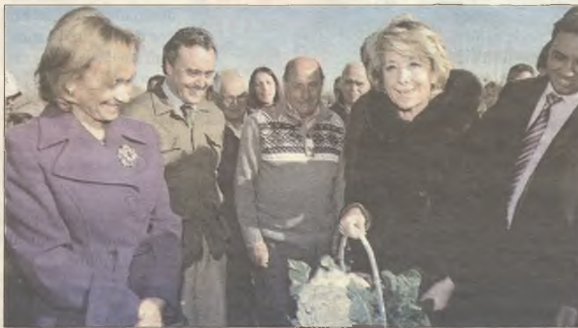
ENTRE COLES. La presidenta con la cesta de productos que le regalaron

Él es uno de los arrendatarios de los 239 huertos de ocio que ocupan parte de esta finca. Desde hace más de 20 años, la CAM promueve un ocio saludable poniendo a disposición de los vecinos de San Fernando de Henares, Coslada, Torrejón de Ardoz, Mejorada del Campo y Alcalá de Henares pequeños huertos que se encuentran dentro del