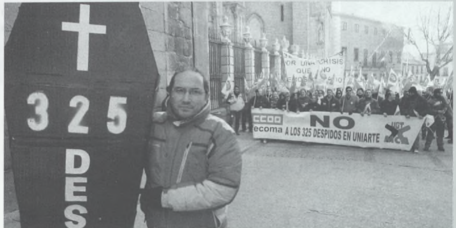
DIÁLOGO Y MOVILIZACIÓN FRENTE A LA CONFLICTIVIDAD LABORAL

Los precios cayeron en enero un 1'1% en Castilla-La Mancha y un 1% en Toledo, arrastrados fundamentalmente por las rebajas. Así, las prendas de vestir redujeron los precios más de un 12% y un 10% el calzado. En el grupo de alimentos, las mayores caídas las registró la carne de ovino (un 3'5%?, seguida por el aceite, el agua mineral y los zumos y otras carnes. La mayor subida de precios la registró el pescado (2'1%). En el último año los precios en la región se han incrementado un 0'9% y un 0'8% en Toledo.