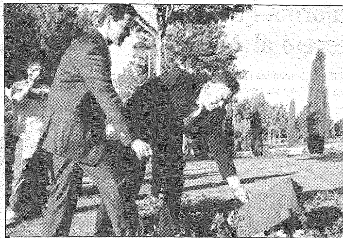
El alcalde ciudadrealeño descubre la placa conmemorativa de la ampliación del Parque de Gasset.

sable de Medio Ambiente, las obras se han hecho con un diseño respetuoso para ahorrar agua y el bajo coste de mantenimiento que necesita, también pidió a los