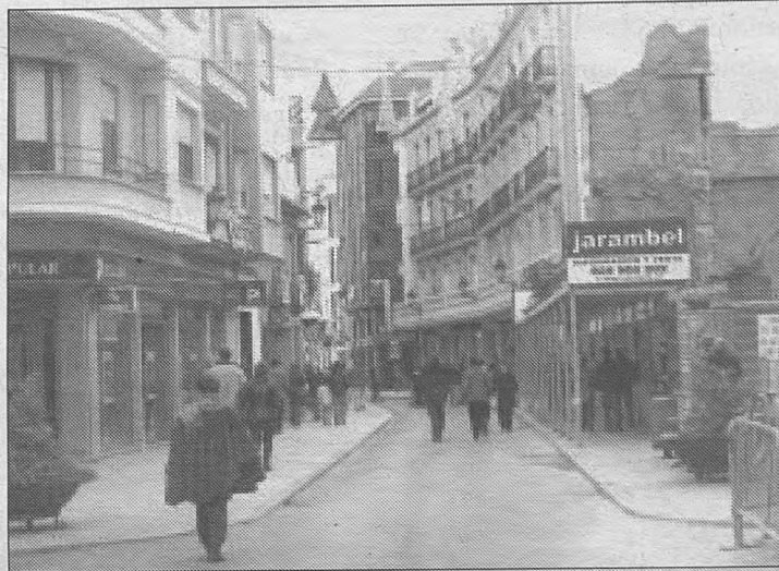
Según Casero, el POM, cuyo pliego de condiciones ya ha sido publicado en el Diario Oficial de la Unión Europea, será el documento que definirá el Tomelloso del futuro.

Con todo ello, para la concejala de Urbanismo, el nuevo POM será un hito en la historia de Tomelloso y como tal es de esperar que el proceso permita la contratación de una buena consultora y buen equipo de profesionales. Además, según se establece en el pliego de condiciones, la impor-