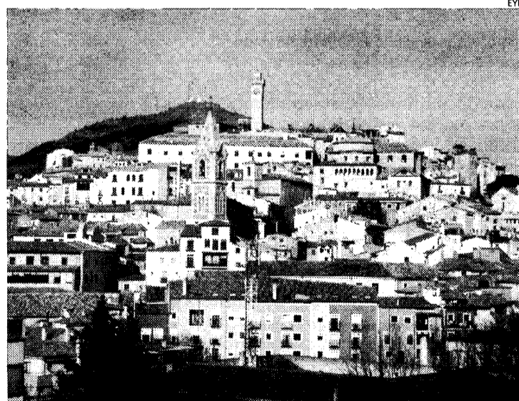
En el futuro cubrirá a una población de 13.000 personas.

La Junta construirá esta nueva infraestructura sanitaria para la ciudad de Cuenca en una parcela de 4.000 metros cuadrados que