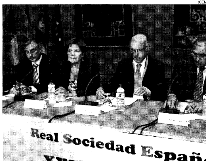
El objetivo, mejorar la inversión en innovación y desarrollo.