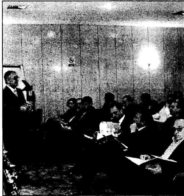
Fedeto (a la izquierda) y la Cámara de Comercio de Toledo han organizado por separado unas jornadas sobre economía familiar.

Las consultoras que ofrecieron las conferencias concluyen que estas empresas están tendiendo a convertirse en holdings familiares