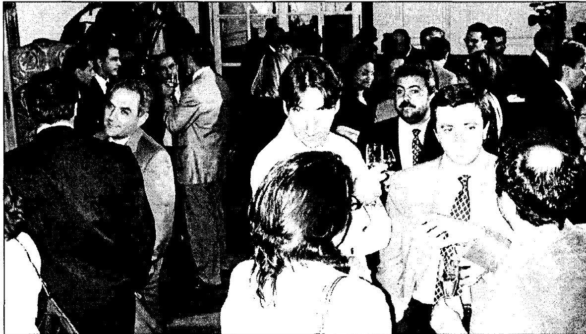
Los asistentes pudieron conocer de primera mano las perspectivas de futuro del Grupo EL DIA.

encontraban representantes de las agencias de publicidad Carat, Universal, Ara, Bassat, Parnesí, Arena, Media Planning, Easy, La Banda y Red de Medio, entre otras.