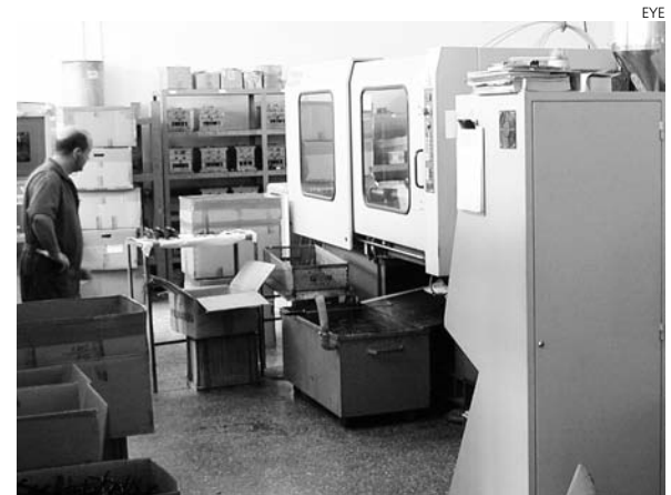
Más información para las empresas.