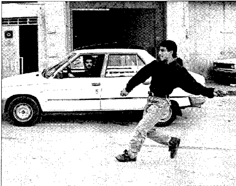
DIÁLOGO MINERAL Un palestino apunta con una piedra a militares israelíes, ayer en Hebrón.

Agentes de la policía y del Servicios de Seguridad General (Shabak) controlan a los más radicales de esos elementos y algunos de ellos han visto limitados sus movimientos, lo que les impide llegar a algunas localidades