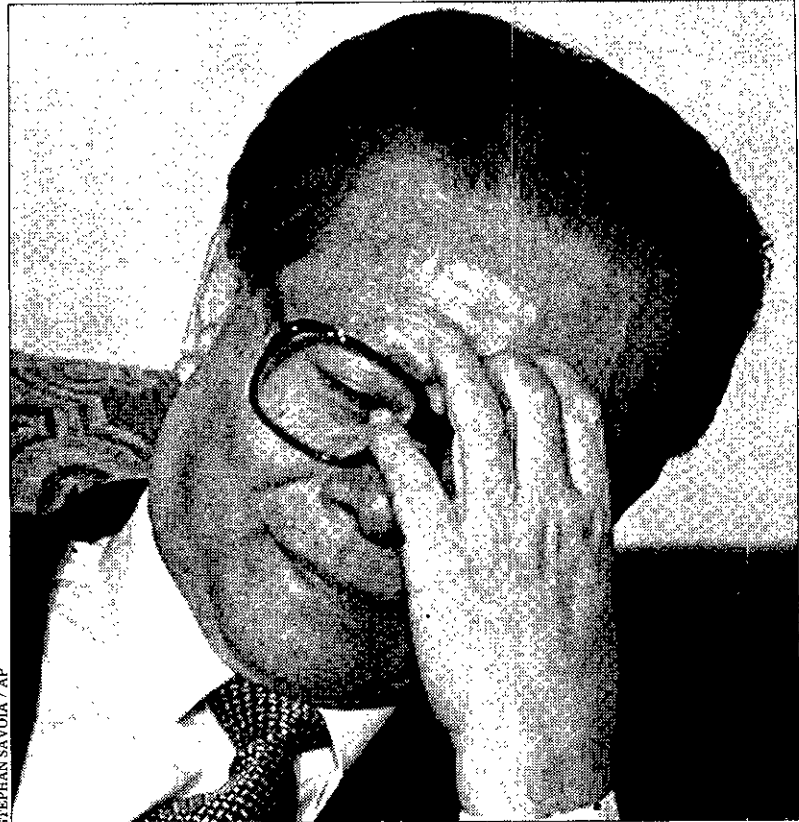
DOLOR DE CABEZA El presidente chino, Jiang Zemin, con gesto de cansancio mientras espera a tomar parte en una de sus últimas apariciones en su visita a Estados Unidos donde Zemin reconoció que la masacre de Tiananmen pudo haberse tratado de un "error" del Gobierno de Pekín, entonces dirigido por Deng Xiaopin.

Según el disidente, no fue Jiang Zemin quien tomó las principales decisiones en 1989, pero sí otros dirigentes que aún siguen en cargos de liderazgo, como el primer ministro, Li Peng. La Prensa china no mencionó el comentario de Jiang Zemin.