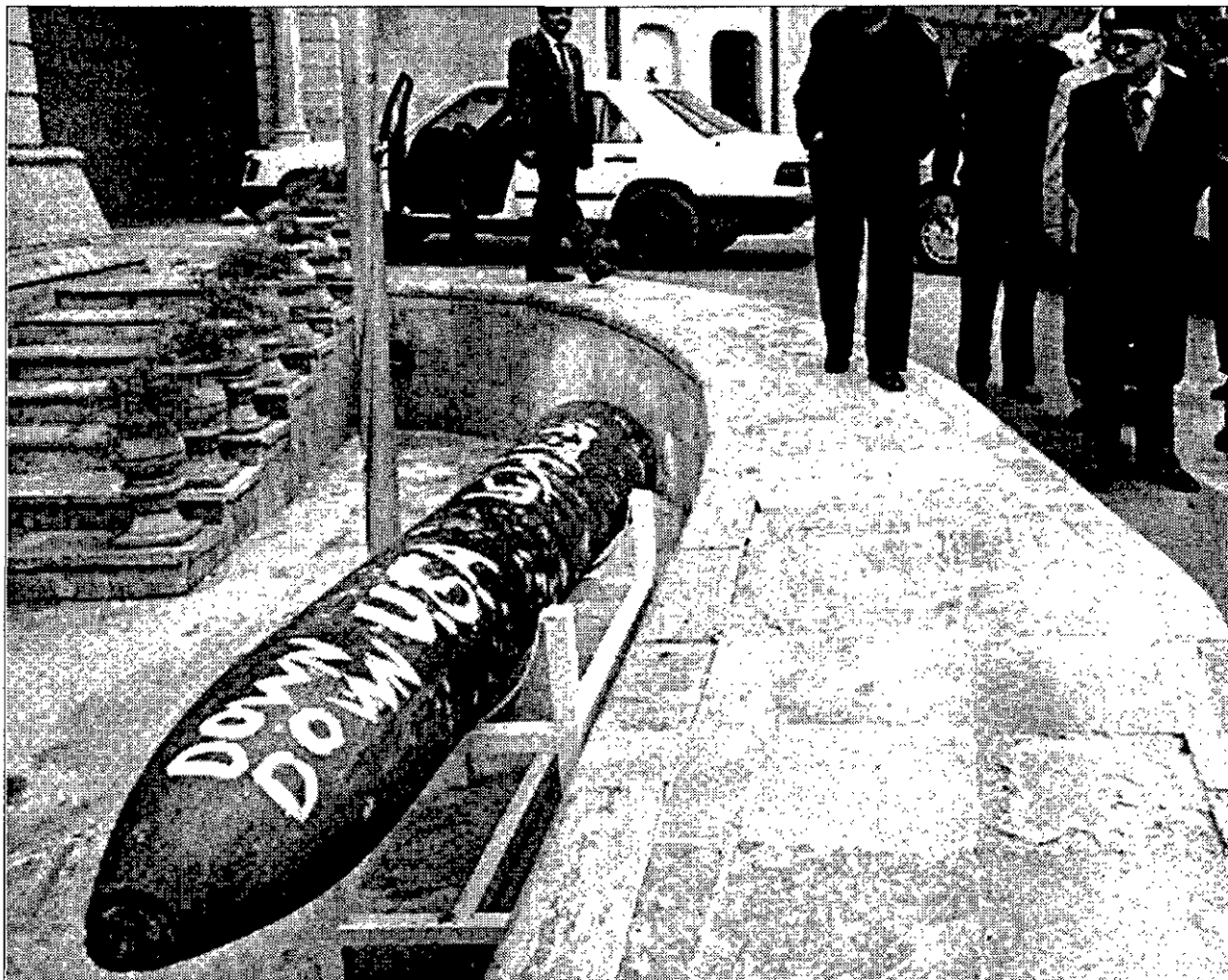
ESTAMOS LIMPIOS El viceprimer ministro iraquí, ayer junto a un grupo de periodistas a la entrada del palacio presidencial de Al Bairak.

El Gobierno de Saddam Hussein anunció esta semana que los inspectores internacionales no tendrán acceso a los palacios presidenciales.