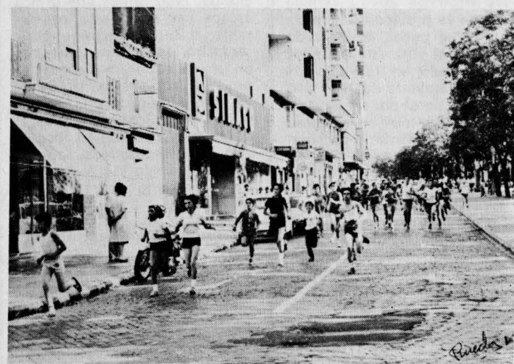
Escenas de la III Caminata Popular, que esta vez contó con poca participación, unos 250 aproximadamente.

En la página 12 en la primera fotografía que representa la inauguración de las Fiestas de Mayo, es el Excmo. Gobernador Civil el que corta la cinta; a la izquierda de la fotografía se encuentra el Presidente de la Diputación y a la derecha se encuentra el Sr. Alcalde.