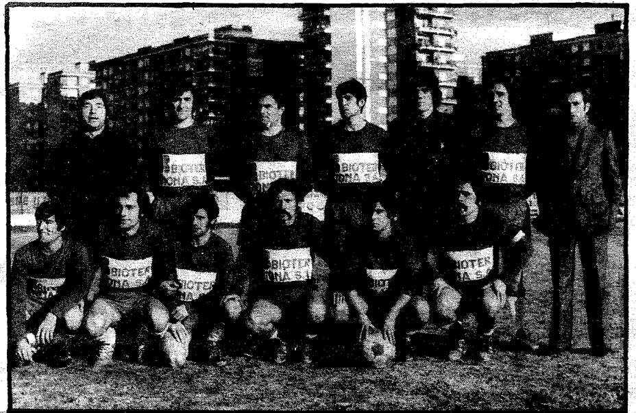
Equipo Bioter-Biona que participa en el citado Campeonato.