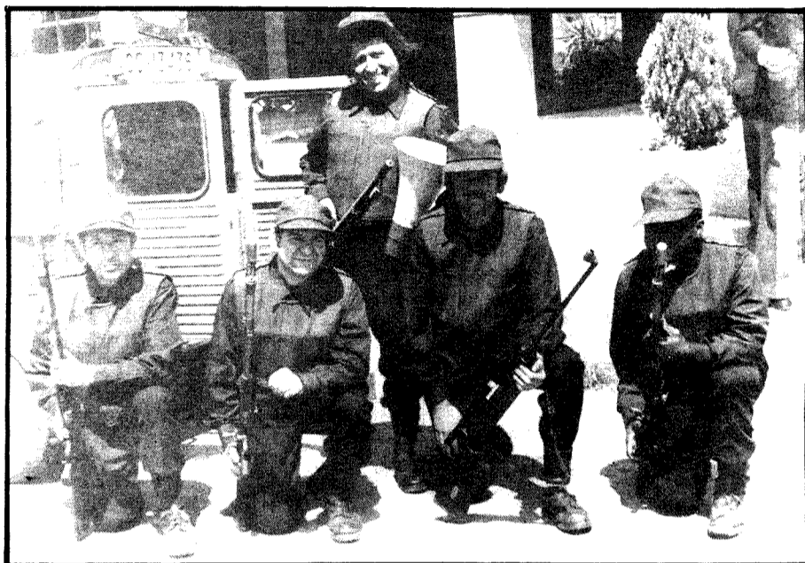
Esteso y su equipo parodia a "Los hombres de Harrelson" en "625 líneas".