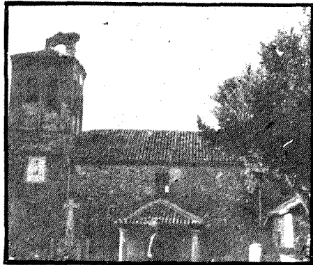
La iglesia parroquial.

Lo más probable es que los núcleos de asentamiento humano ya definitivos fueran surgiendo hacia el siglo XIII, tras la aparición, en el monte de "La Morra", de la Virgen de Gracia. La fuente donde