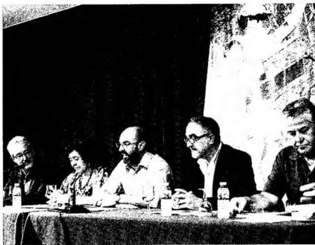
El alcalde, los autores y miembros de Los Académicos.