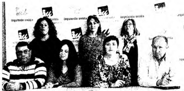
Miembros de la lista de IU en rueda de prensa.