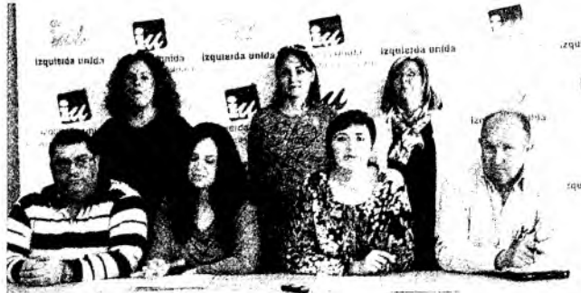
Miembros de la lista de IU en rueda de prensa.