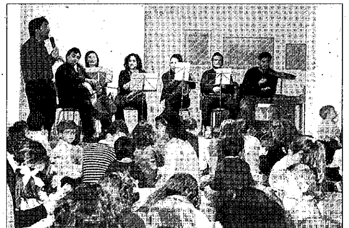
Uno de los momentos de la actividad musical.