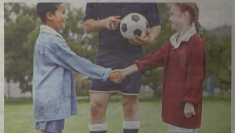
Los niños aprenderán a comportarse en sus deportes.

como en el lenguaje. Y mucho más, cuando se acude a las gradas de un estadio, donde uno puede dejarse llevar por el ambiente.