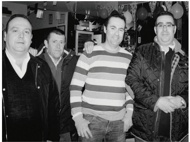
Varios de los hosteleros adheridos a la ruta