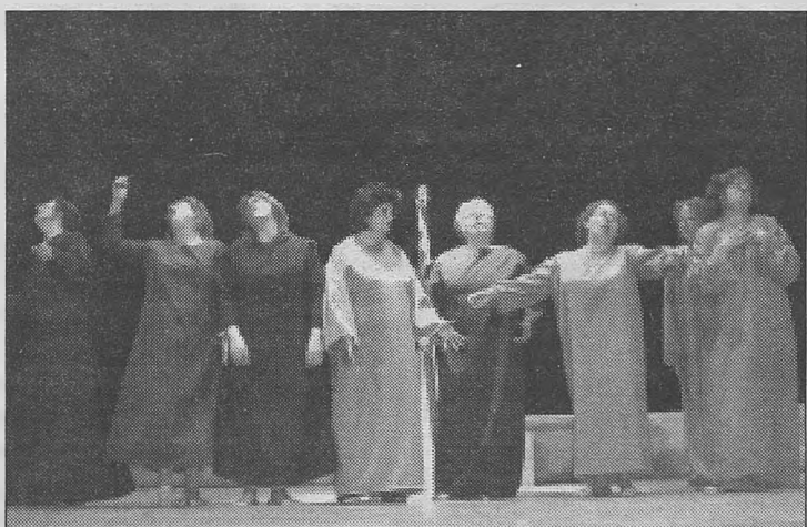
En la iniciativa, que cuenta con el apoyo de la Diputación Provincial, podrán participar todos los grupos no profesionales que lo deseen, con un montaje teatral en idioma castellano sobre tema libre.

El jurado determinará y seleccionará los tres grupos que han de intervenir en dicho certamen, así como los suplentes. El certamen se celebrará en la Casa de Medrano de Argamasilla de Alba a lo largo de cuatro jornadas durante los primeros meses de 2007 aunque los grupos que deseen formar parte en el mismo deberán enviar la documentación necesaria antes del 15 de noviembre de 2006 al Ayuntamiento de Argamasilla de Alba (Área de Cultura),