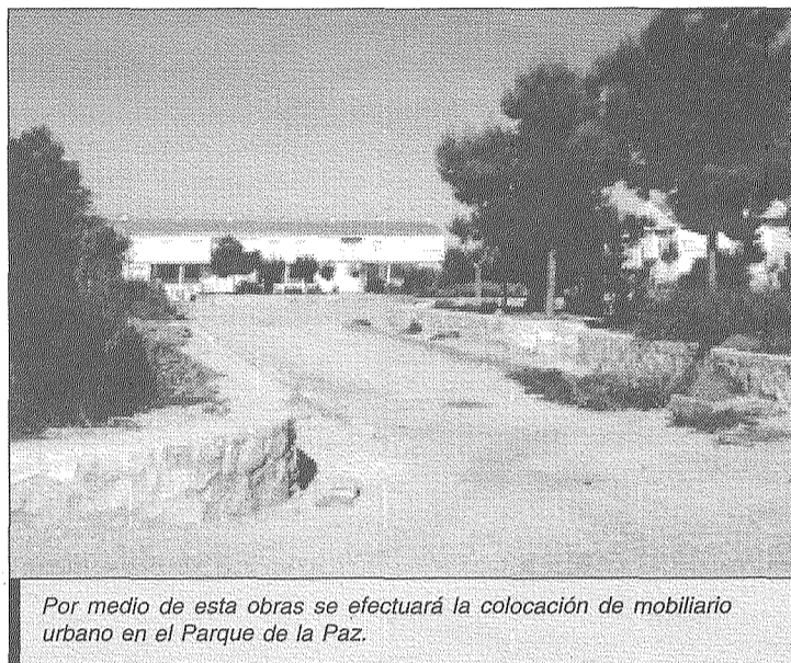
Por medio de esta obras se efectuará la colocación de mobiliario urbano en el Parque de la Paz.

Para esta fase se contratarán durante tres meses a 67 trabajadores, teniendo un presupuesto total de 295.676 euros, de los que 170.850, correspondería a la mano de obra objeto de la solicitud de